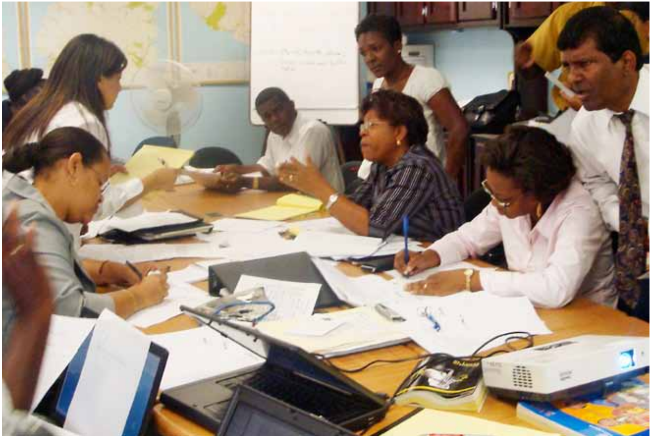
Evaluando el sistema de respuesta de emergencia en Santa Lucía en anticipación a una pandemia de influenza.

Para información adicional acerca de la asistencia técnica de comunicación de Links Media para la preparación y respuesta ante una influenza aviar y pandémica, visite nuestra página Web: www.influenzalac.org .